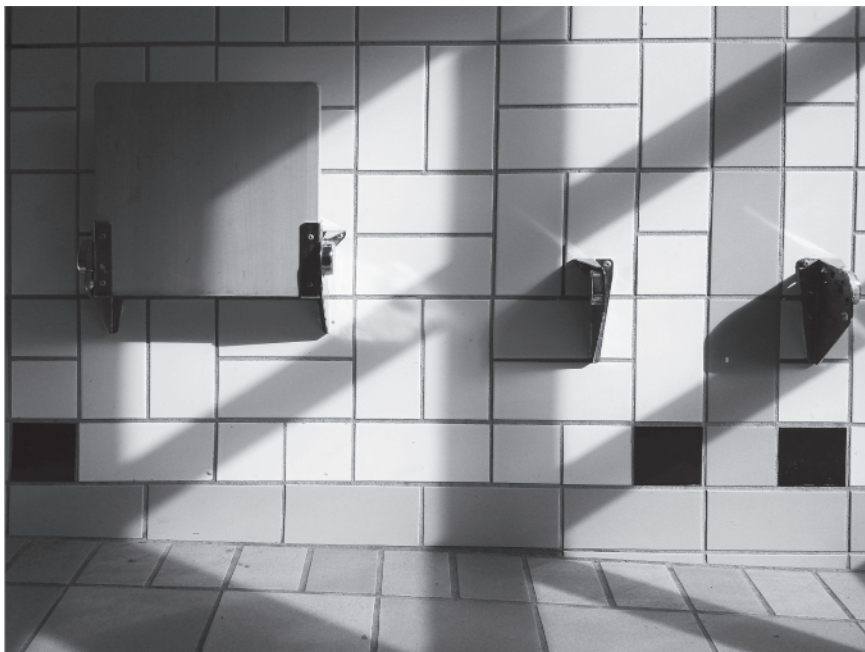
Ett upp och ett i minnet. Kakel, trä och stål. Ungdomssektionens volontärgrupp. "En spark rätt upp i ändan på den stillasittande borgerligheten."