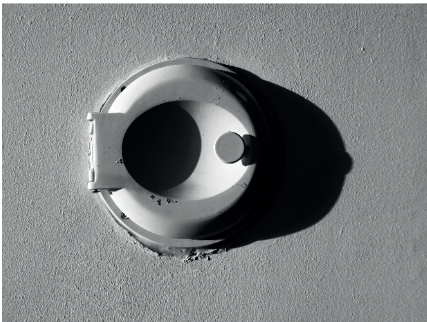
En doft av den fina världen. Lättmetall och betong. Svenska Bostäder-kollektivet. "Ett verk som talar till samtliga sinnen - inte minst luktsinnet."