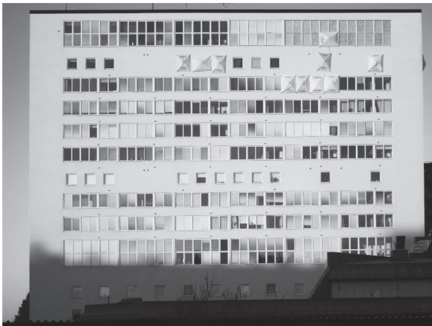
Förblindad. Betong, glas och trä. Tumba Glas 2013. "Georg Varhelyis konstruktion från 1957 får nytt innehåll genom den genialiska idén att ersätta utblick med påtvingad introspektion."