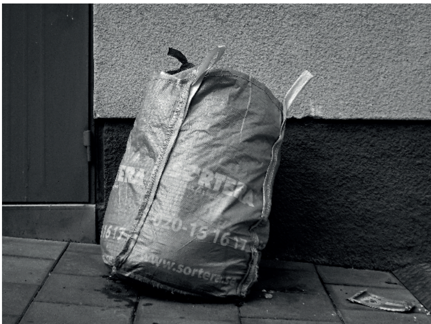
Längtan. Plast och avfall. Sortera. "Den enskildes utsatthet skildrad med utsökt känsla för hur även en önskad individ kan överleva trots omgivningens krav på dess bortgång."